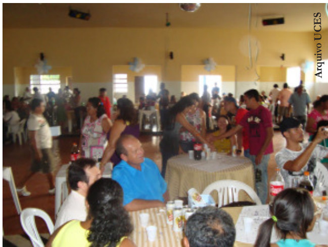
SAB's se uniram em confraternização

A programação contou com várias atrações, entre elas o coral da UCES, formado por integrantes da associação, a banda Gingado Maneiro, da SAB da Bela Vista, e contou ainda com a participação do cantor Ranieri. Além das atrações musicais, ocorreram também os sorteios de