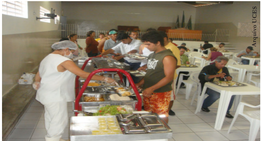
Cozinha Comunitária da Liberdade atende em média 300 pessoas por dia

de dos moradores e trabalhadores do bairro, o restaurante, contudo, não restringe o atendimento apenas a eles. Estará aberto para receber a todos, indiscriminadamente, de forma igualitária, com a cobrança simbólica de um real, mesmo valor exigido nas seis cozinhas comunitárias da cidade e no restaurante popular do centro de Campina Grande. Acredita-se que, assim como nos demais bairros contemplados, a vida da população será facilitada – e o seu bolso poupado. Por exemplo: se um trabalhador que considerava inconveniente almoçar em casa antes pagava cerca de R$ 5,00 por refeição, nos “restaurantes privados” dos arredores das empresas, em breve poderá pagar apenas R$ 1,00. Trocando em miúdos, o que antes ele gastava para se alimentar num dia renderá para uma semana inteira de trabalho!