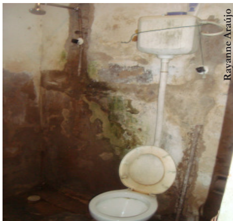
Banheiro de casa de moradora com vários problemas de infra-estrutura