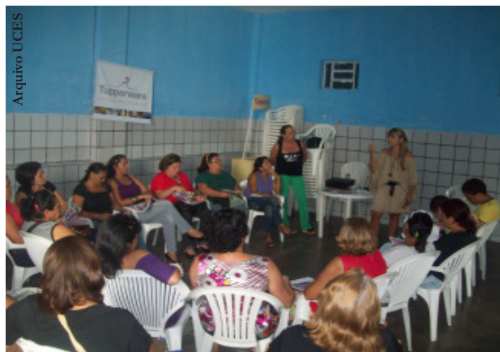
Oficinas foram oferecidas para as participantes

Com eventos realizados na FIEP, na Praça da Bandeira, na Sede da UCES, em Clubes da Mães e em escolas municipais, a Semana da Mulher, além de prestar serviços como consultas